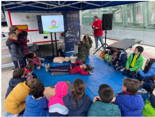
TALLER RCP PARA NIÑOS