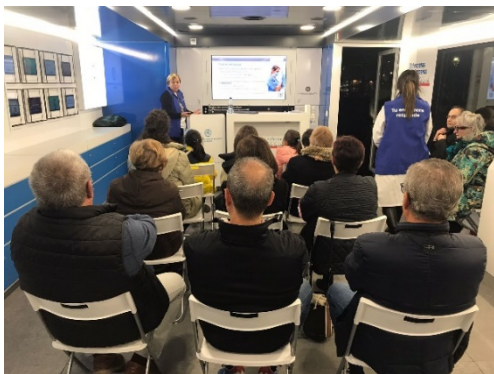
CHARLA PREVENCIÓN DEL SUICIDIO