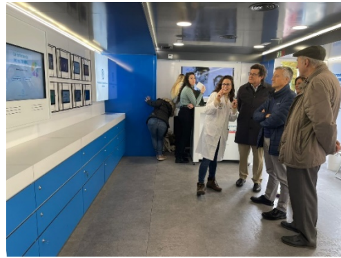
GUÍA POR EL AUTOBUS